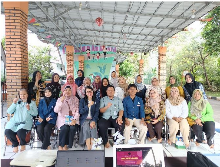
Gambar 3. Foto bersama tim pengabdian dengan peserta

Materi kedua tentang gizi pada ibu menopause disampaikan dalam beberapa topik antara lain: a) pentingnya gizi pada ibu menopause, b) mengenali kalsium, vitamin dan zat besi pada ibu menopause, c) makanan yang dianjurkan pada ibu menopause, d) makanan yang dihindari pada ibu menopause dan e) prinsip gizi seimbang pada ibu menopause.