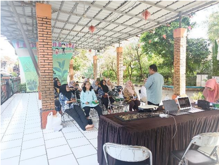
Gambar 2. Pemberian materi kedua ke peserta

Materi kedua tentang gizi pada ibu menopause disampaikan dalam beberapa topik antara lain: a) pentingnya gizi pada ibu menopause, b) mengenali kalsium, vitamin dan zat besi pada ibu menopause, c) makanan yang dianjurkan pada ibu menopause, d) makanan yang dihindari pada ibu menopause dan e) prinsip gizi seimbang pada ibu menopause.